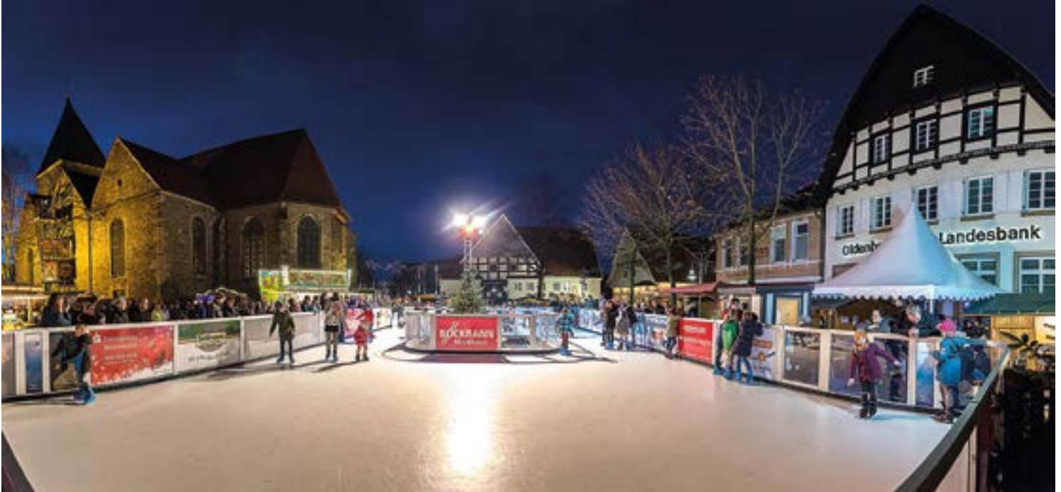
Ein Highlight für alle Altersstufen: das CITY BRAMSCHE EIS-VERGNÜGEN

(PM) Am Freitag, dem 25.11.2022, öffnet die Bramscher Kunsteisbahn auf dem Kirchplatz wieder ihre Tür. Bis zum 08.01.2023 haben Jung und Alt die Möglichkeit, das Eislaufen und die vorweihnachtliche Stimmung in der Innenstadt zu genießen.