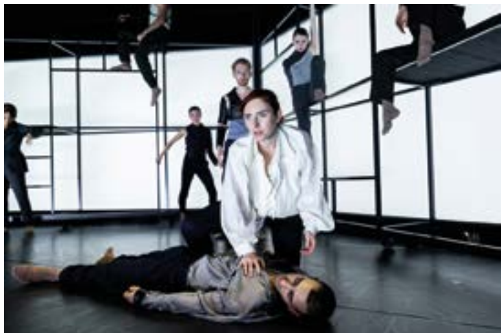
Inszenierungsfoto Romeo und Julia

Ob Theater, Schauspiel, Musical... für jeden Geschmack ist etwas dabei!